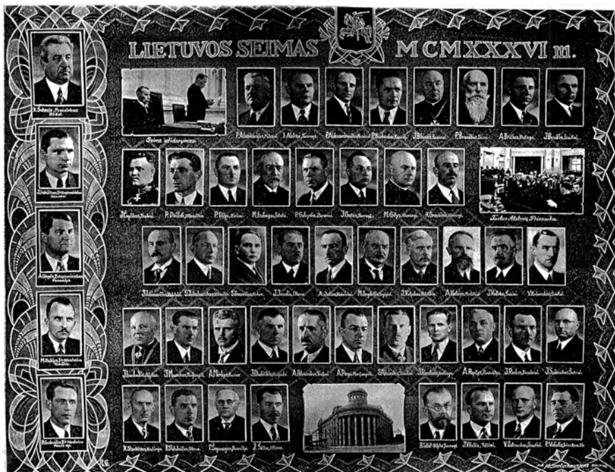
Tautos atstovai. Kairėje iš viršaus žemyn: Seimo prezidento nariai; viršutiniame kampe: Resp. Prezidentas A. Smetona kalba, atidarydamas Seimą. Ministeris Pirmininkas J. Tūbelis — pirmininkaujantis Seimo atidarymo metu. Dešinėje, antroji vietoj iš viršaus: Tautos atstovai dvasia prisieikę Seimo atidarymo metu. Apačioj, vidury: Seimo rūmai.