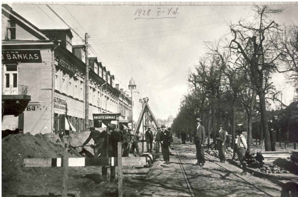
Vandentiekio tiesimo darbai Kaune 1928 m. Projekto autorius S. Kairys.