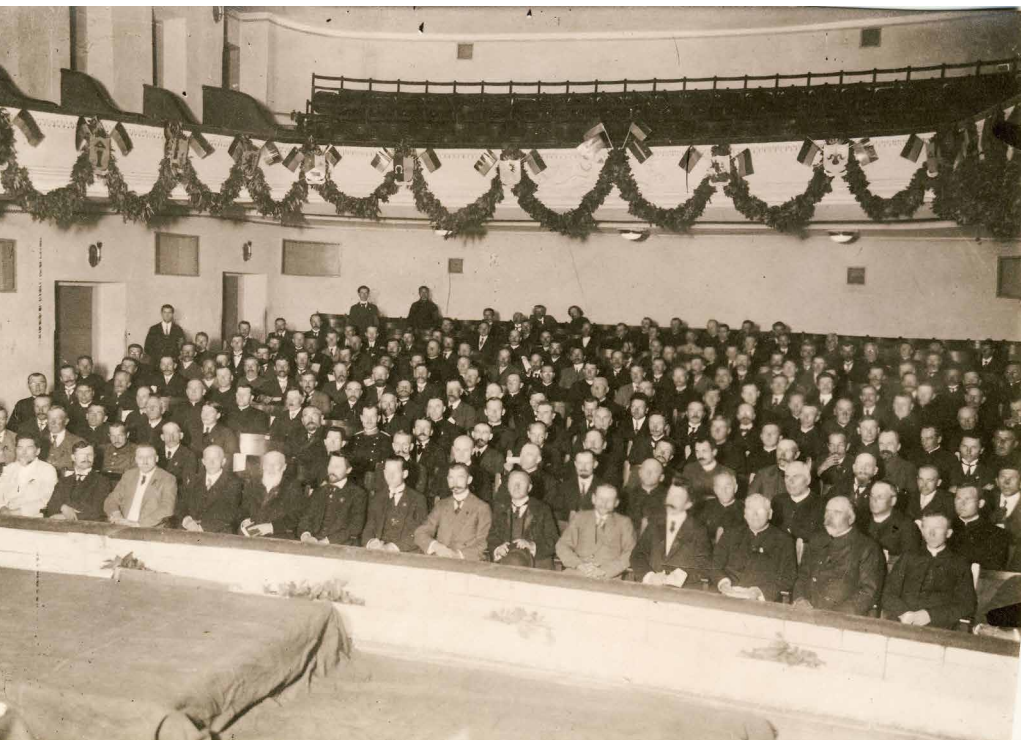
Lietuvių konferencijos salės vaizdas. (A. Jurašaitytės nuotr.) (Originalas – KTU bibliotekoje.)