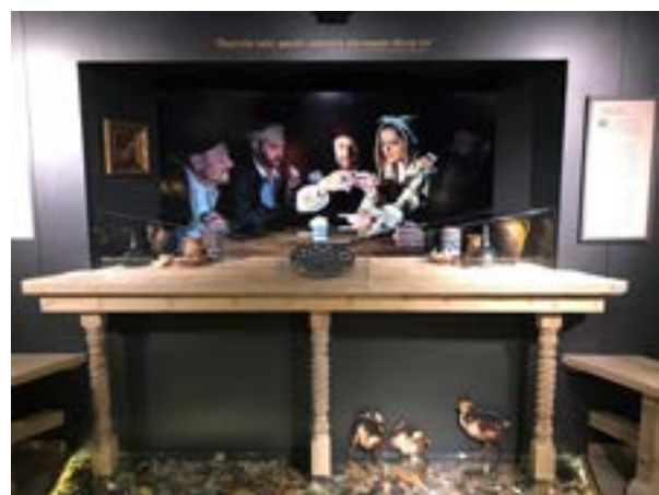
15 iliustracija. Klaipėdos ekspozicija „Kurtina“. Rekonstruota užeiga. 2022.