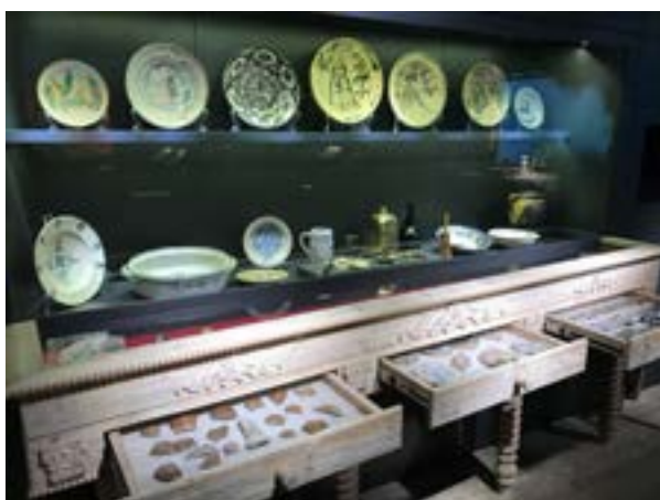
14 iliustracija. Klaipėdos ekspozicija „Kurtina“. Indaujoje eksponuojami artefaktai. 2022.

Tradicinio eksponavimo palei sienas čia atsakyta. Artefaktai išdėstyti ne tik įprastose vitrinose, bet ir įkomponuoti į pirmines aplinkas. Pavyzdžiui, serviravimo indai tvarkingai sudėti medinėje indaujoje (žr. 14 iliustraciją). Užeigos kasdienybę atspindinys artefaktai (bokalai, pypkės, lėkštės) eksponuojami ant stalo, o kitoje jo pusėje sėdi hologramos būdu atkurti užeigos lankytojai. Grindyse po stalu įmontuotoje dar vienoje vitrinoje – archeologiniai radiniai: keramikos ir stiklo šukės, monetos, gyvulių kaulai ir kt. (žr. 15 iliustraciją). Tokia eksponavimo prieiga ne tik atspindi to meto požiūrį į tvarką, bet ir nebyliai liudija, kad archeologų randamos materialinės liekanos yra tik praeities žmonių išmesti ar netyčia prarasti daiktai.