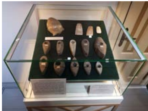
6 iliustracija. Šilutės Hugo Šojaus muziejus. Akmens amžiaus ekspozicijos dalis. 2021.