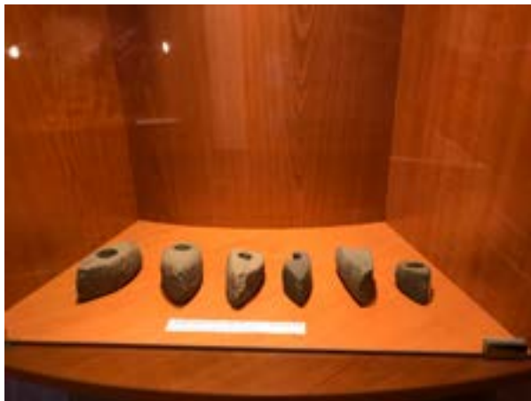
5 iliustracija. Tauragės krašto muziejaus Archeologijos bokštas. Akmens amžiaus ekspozicijos dalis. 2022.