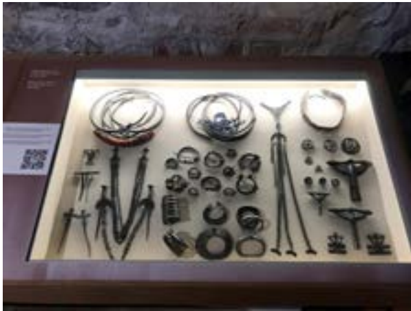
1 iliustracija. LNM Gedimino pilies bokšto ekspozicija, eksponatų dekontekstualizavimo pavyzdys. 2022.