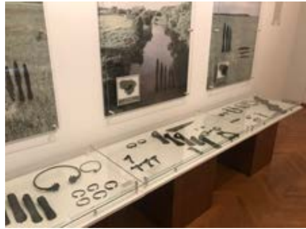
2 iliustracija. Kėdainių krašto muziejaus ekspozicija, dekontekstualizavimo pavyzdys. 2021.

Kiek kitaip pranešimas konstruojamas Joniškio istorijos ir kultūros, Kelmės krašto muziejaus ekspozicijose, LNM Gedimino pilies bokšto ir Valdovų rūmų ekspozicijose. Kelmės krašto muziejaus ekspozicijoje chronologinis pasakojimas perteikiamas pasitelkiant ne periodizacijas, o veikia konkrečius Kelmės rajono archeologinius paminklus ir juose rastus artefaktus. Šiuo atveju pateikiama tik susisteminta konkrečių tyrimų medžiaga, o praeityje vykę procesai neanalizuojami. Kitose ekspozicijose, nors ir formuojamas teminis pranešimas (Joniškio istorijos ir kultūros muziejaus ekspozicijoje pristatoma žiemgalių kultūra, LNM Gedimino pilies bokšto ekspozicija reprezentuoja aukštutinės pilies raidą, Valdovų rūmuose pristatoma ginkluotė, valstybės išdas, mitybos ypatumai ir pan.), eksponatai atsako į tuos pačius klausimus: kas, kada ir kokio tipo. Valdovų rūmų pranešimo konstravimą sunkina noras aprėpti kiek įmanoma platesnius rūmų raidos etapus (archeologiniai radiniai eksponuojami 14 salių), o eksponatų skirstymas į tipus vienas ryškiausių iš visų analizuojamų ekspozicijų. Atsižvelgiant į eksponatų gausą, galima numanyti, kad nesiekama analizuoti materialinių liekanų, o artefaktų užduotis ekspozicijoje – kalbėti patiems už save.