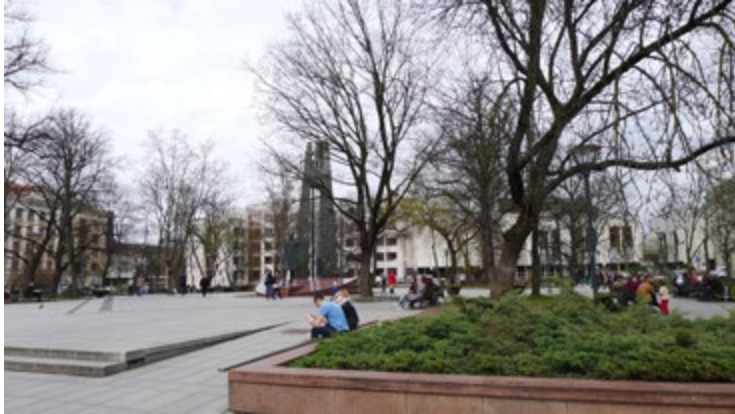
3 iliustracija. Vincas Kudirkos aikštė. 2022 m.