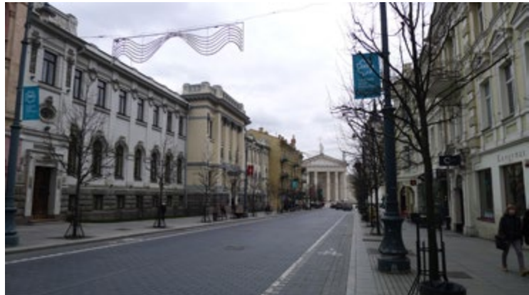
2 iliustracija. Prospekto vaizdas į Katedros pusę, kairėje – secesinio stiliaus Lietuvos mokslų akademijos pastatas. 2022 m.

žr. 2 iliustraciją), o kitoje, jau anapus upės, bet toje pačioje perspektyvoje – bizantiškojo stiliaus stačiatikių Dievo Motinos ikonos „Ženklas iš Dangaus“ cerkvę, pastatytą 1903 m. (architektas Michailas Prozorovas). Tačiau topografiškai yra atvirkščiai: pagrindiniai katalikiški simboliai susitelkę rytiniame prospekto gale, o stačiatikiškieji – vakariniame.