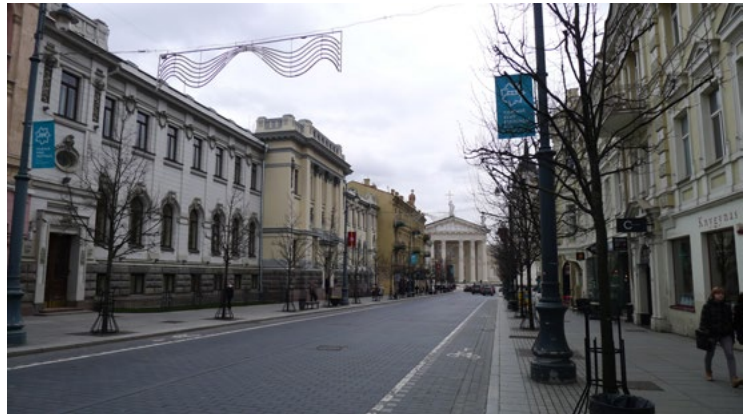
2 iliustracija. Prospekto vaizdas į Katedros pusę, kairėje – secesinio stiliaus Lietuvos mokslų akademijos pastatas. 2022 m.

žr. 2 iliustraciją), o kitoje, jau anapus upės, bet toje pačioje perspektyvoje – bizantiškojo stiliaus stačiatikių Dievo Motinos ikonos „Ženklas iš Dangaus“ cerkvę, pastatytą 1903 m. (architektas Michailas Prozorovas). Tačiau topografiškai yra atvirkščiai: pagrindiniai katalikiški simboliai susitelkę rytiniame prospekto gale, o stačiatikiškieji – vakariniame.