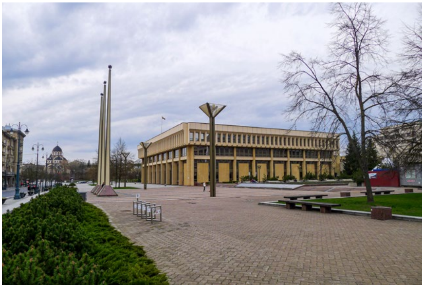
7 iliustracija. Prospekto pabaiga – Nepriklausomybės aikštė su Lietuvos Respublikos Seimo pastatu (dešinėje) ir Dievo Motinos ikonos „Ženklas iš dangaus“ cerkve Žvėryne. 2022 m.

Prospektą užbaigia ideologiškai vienareikšmiškiausia Nepriklausomybės aikštė, esanti šalia Lietuvos Respublikos Seimo rūmų. Ši aikštė primena Dainuojančios revoliucijos ir Lietuvos atsiskyrimo nuo SSRS paskelbimo laikus bei dramatiškus 1991 m. sausio 13 d. įvykius, kai prie Vilniaus televizijos bokšto sovietų kareiviai nužudė 14 civilių gyventojų (žr. 7 iliustraciją).