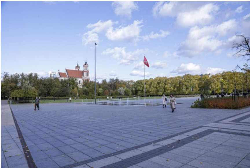
6 iliustracija. Lukiškių aikštės dabartinis vaizdas (po jos 2016–2017 m. rekonstrukcijos). 2024 m.

Nepaisant to, kad nuo pat Nepriklausomybės atkūrimo vyksta aktyvios viešos diskusijos dėl naujo ideologinio ženklo reikalingumo ir meninės formos bei atitinkamos naujos Lukiškių aikštės funkcijos, taip pat buvo surengtas ne vienas architektūrinis ir meninis konkursas 53 , šis klausimas tik iš dalies buvo išspręstas perprojektavus aikštės dangą ir pavertus ją keistu aikštės ir skvero su kreivais takeliais hibridu, taip pat įrengus fontaną (žr. 6 iliustraciją). Gali būti, kad užsitęsusi Lukiškių aikštės pertvarkos epopėja susijusi ne tiek su politinės valios stoka 54 , kiek su dviprasmišku visuomenės požiūriu į per šalies nepriklausomybės laikotarpį susiformavusį tautinį naratyvą ir tokių, ryškiai ideologizuotų, viešųjų erdvių funkcinę panaudą. Nors aikštės urbanistinis pavidalas po paskutinės rekonstrukcijos ir buvo radikaliai transformuotas, nesant bendro politinio, menininkų bendruomenės ir visuomeninio sutarimo, ši erdvė vis dar lieka ideologiškai neapibrėžta 55 . Neatsižvelgiant į tai, kad aikštėje numatytas „centrinis Laisvės kovų simbolis“ joje iki šiol neatsirado, Lukiškių aikštės aplinka vis tiek vizualiai perteikia aiškia žinia apie tragiškus įvykius, tiesiogiai susijusius su šia vieta, – atmintį apie carinės, o vėliau sovietinės represinės mašinos nuslopinimą pasipriešinimą.