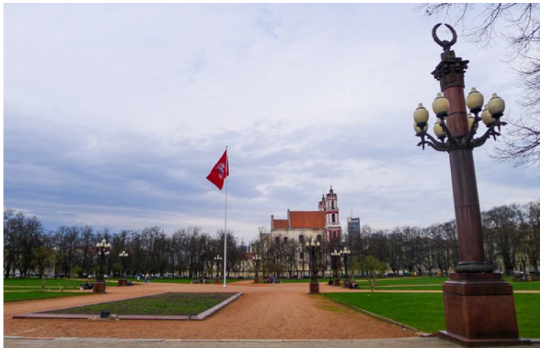
5 iliustracija. Lukiškių aikštės vaizdas prieš jos 2016–2017 m. rekonstrukciją. 2015 m.

Nors šis paminklas mieste buvo demontuotas vienas pirmųjų, stalininis Lukiškių aikštės suplanavimas ilgai išliko nepakitęs 52 (žr. 5 iliustraciją).