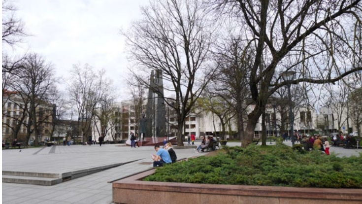
3 iliustracija. Vincas Kudirkos aikštė. 2022 m.